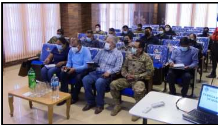
EXPOSICIÓN DE LAS ACTIVIDADES QUE REALIZA LA “F.B.M.”

De igual manera se recibió la visita de la Comisión del Gobierno “Asamblea Legislativa”, quienes se desplazaron por diferentes unidades de las FF.AA. y reparticiones Policial, arribando a la Fabrica Boliviana de Munición para poder interiorizarse y conocer sobre las actividades que se realiza dentro la “F.B.M.”, las necesidades que tiene como empresa y también el apoyo que se puede recibir por parte del Gobierno del Estado Plurinacional de Bolivia.