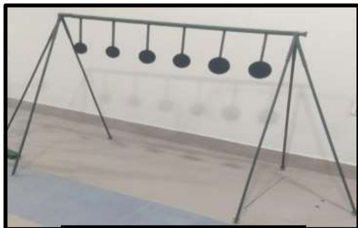
BLANCO TIPO ESCALONADO