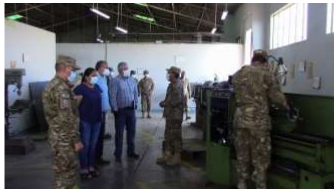
RECORRIDO POR EL TALLER DE METAL MECÁNICA