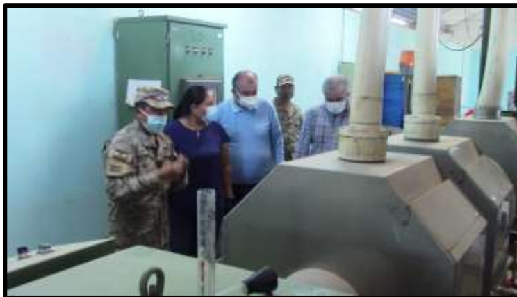
RECORRIDO POR EL TALLER DE VAINAS (ÁREA DE LAVADO)