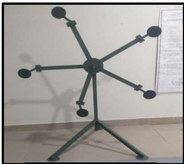
BLANCO TIPO ESTRELLA